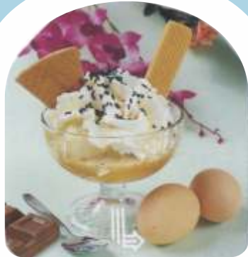
Schweden - Becher Vanilleeis mit Apfelmus, Eierlikör, Sahne und Eiswaffel € 7,50