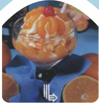
Mandarinen-Becher Milch- und Fruchteis, Mandarinen, Eierlikör, Sahne und Eiswaffel € 7,50