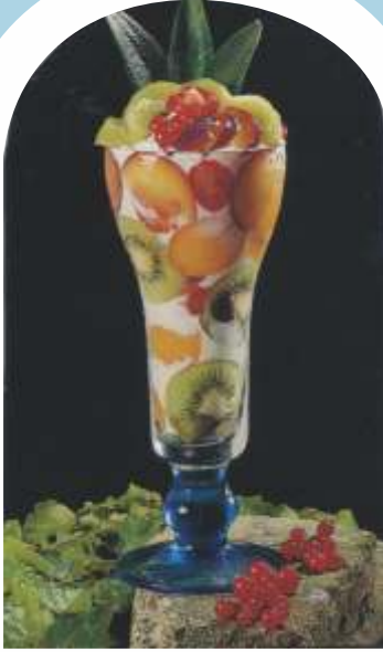
Joghurt - Becher Joghurteis mit Früchten, Joghurt, Sahne und Fruchtsoßen € 7,50