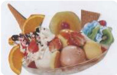
Riesenschale 10 Kugeln Eis, Früchte je nach Jahreszeit, Sahne, Nüsse und Dekor € 13,50